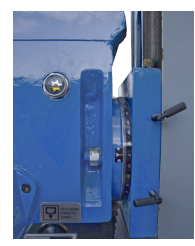
Anzeige der Bohrkopfneigung