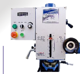
schwenkbarer Bohrkopf mit Digitalanzeige