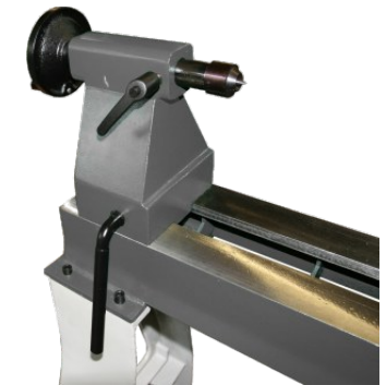
Reitstock m. Schnellverschluss