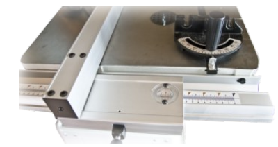
Parallel + Gehrungsanschlag