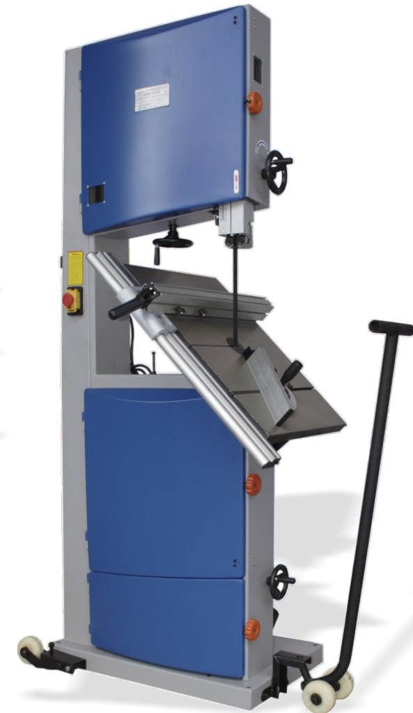
HBS480 inkl. Fahreinrichtung