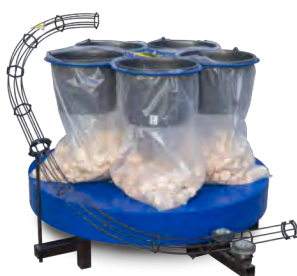
Karussell mit 5 Behältern für Brikettpresse BP-20 bis BP-100F