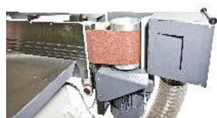
problemloses Öffnen der Absaughaube