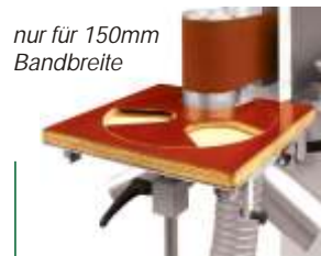
nur für 150mm Bandbreite

Holzprofi Pichlmann GmbH * Watzing 2 * A-4661 Roitham Tel.: +43 (0) 76135600 * pichlmann@holzprofi.com